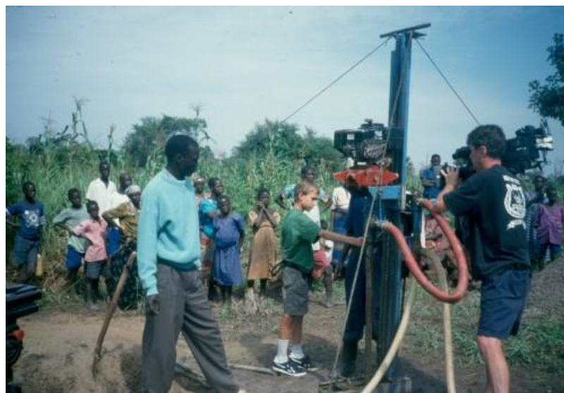
2 Perforación automática de pozo en la escuela de Angolo, Otwal, Uganda.

[...] Las personas grandes nunca comprenden nada por sí solas y es muy aburrido para los niños tener que darles una y otra vez explicaciones. “El principito”